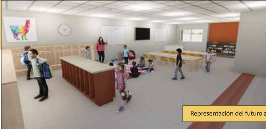
Representación del futuro aula de 5K

Boletín del Distrito Escolar de Richland / Diciembre 2024